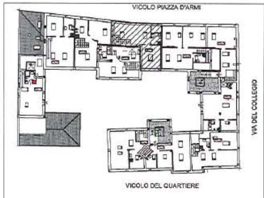
pianta generale scala 1/500 PIANO SECONDO_ sottotetto

DA AGGIORNARE SECONDO SCHEMI DEL CEMENTO ARMATO